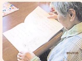
④頭を使わんまいけ （脳トレーニング）