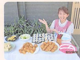
ランチバイキング （行事食）