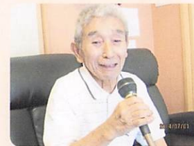
⑥のんびりせんまいけ （カラオケ）