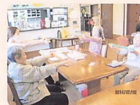
③楽しまんまいけ （体操・ゲーム）