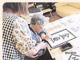
①習わんまいけ （書道）

やりたい事、やりたいけど出来なかった事、得意な事、昔趣味でしていた事を再びできるようお手伝いします。