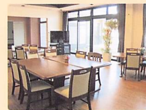
[ダイニング・食堂]