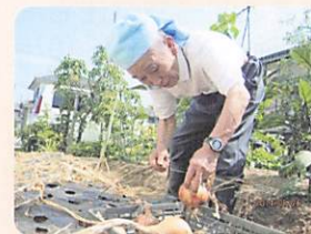
⑤元気でおらんまいけ （園芸）