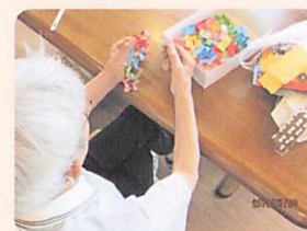
②作らんまいけ （作品制作）